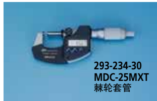
293-234-30 MDC-25MXT 棘轮套管